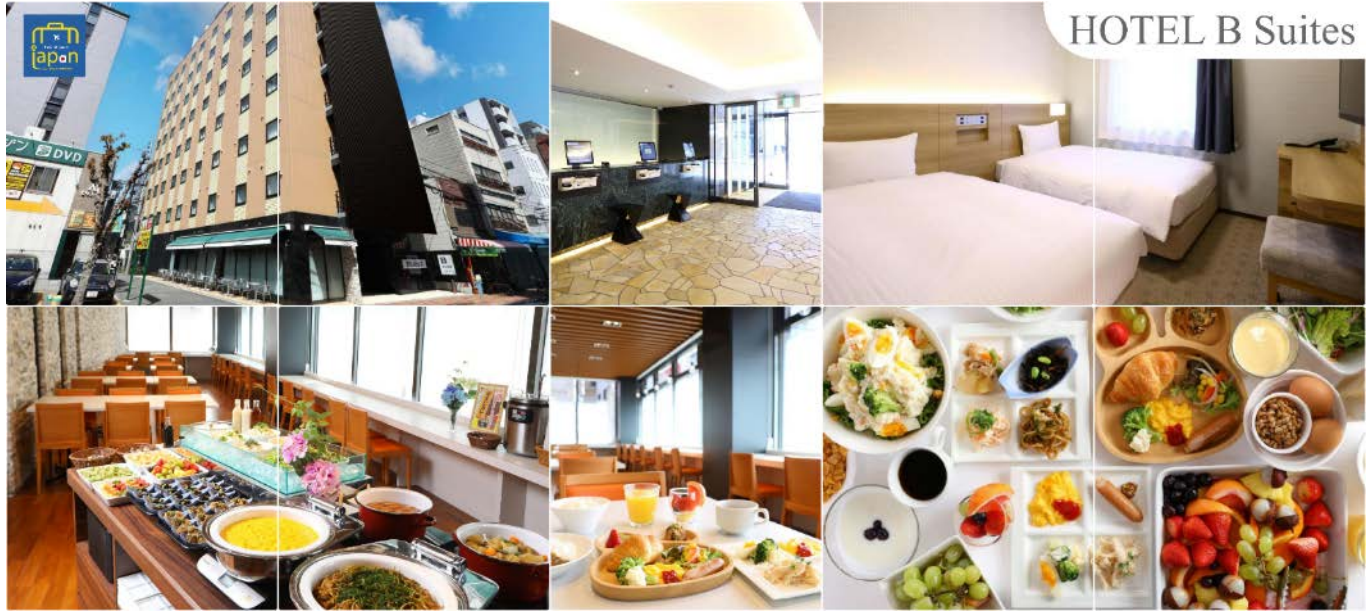
HOTEL B Suites

พักที่ HOTEL B SUITES NAMBA, OSAKA หรือเทียบเท่าระดับเดียวกัน