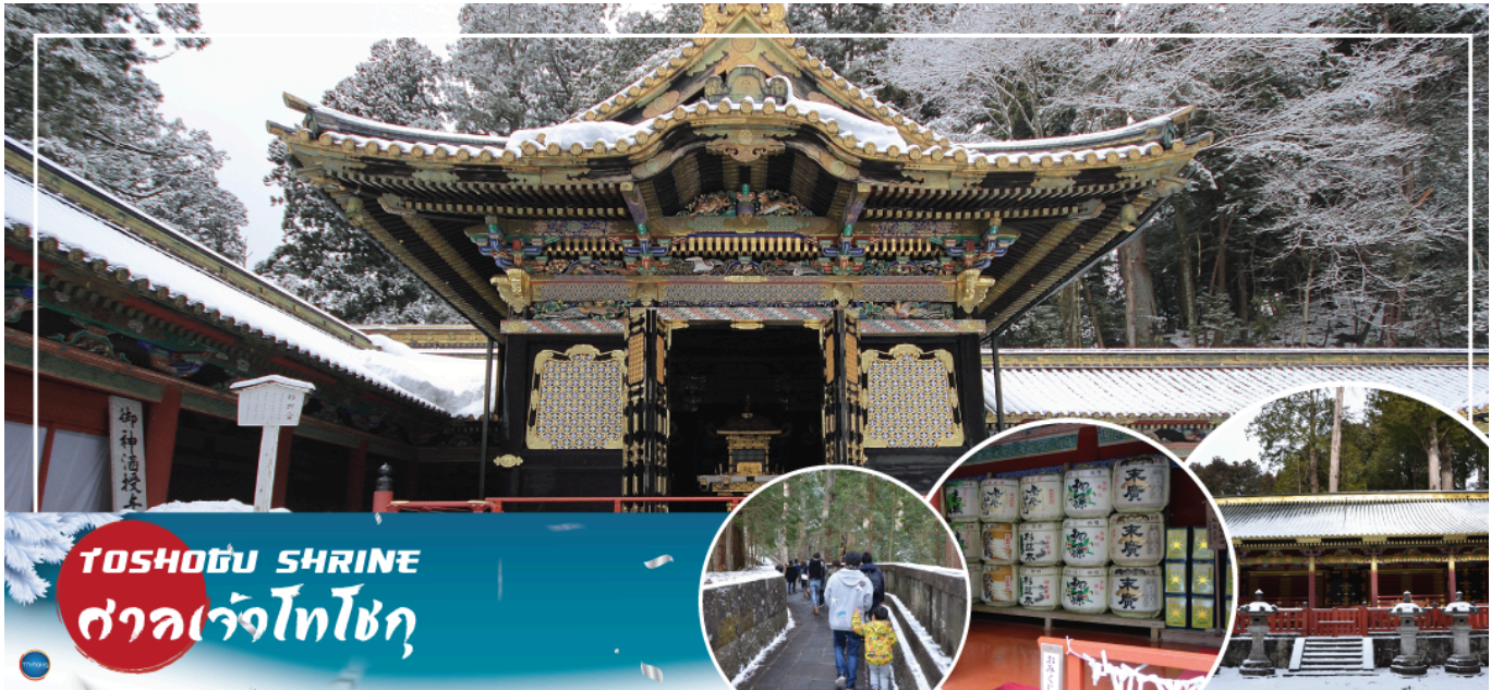
TOSHOGU SHRINE ศาลเจ้าโทโชกุ