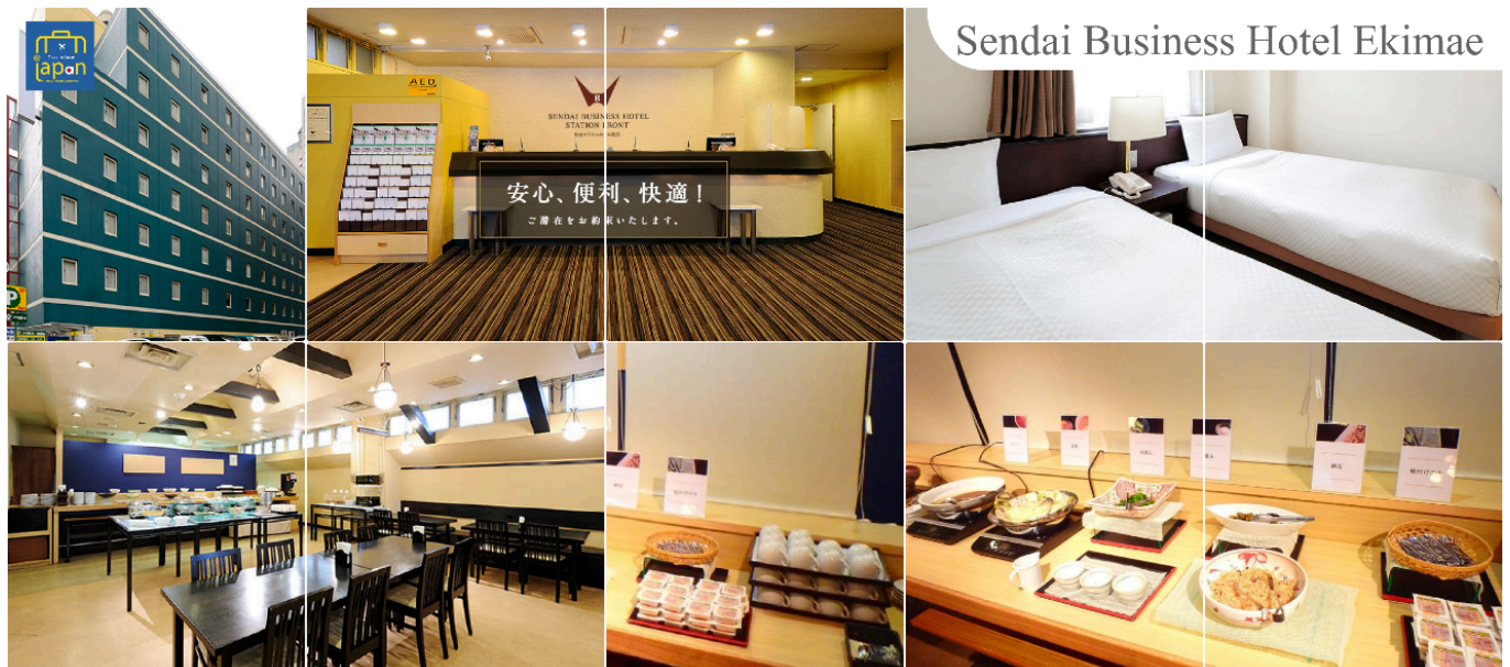
Sendai Business Hotel Ekimae

SENDAI BUSINESS HOTEL EKIMAE หรือเทียบเท่าระดับเดียวกัน