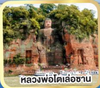
หลวงพ่อดเล่อซาน