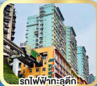
รถไฟฟ้าทะเลตึก