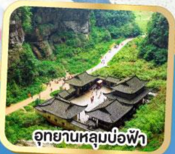
อุทยานหลุมบ่อฟ้า