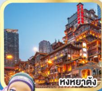
หงหยาดัง