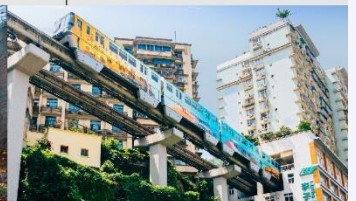
รถไฟฟ้าทะเลตึก

*ทางบริษัทฯ ขอสงวนสิทธิ์ในการสลับโปรแกรมทัวร์ตามความเหมาะสมขึ้นอยู่กับสถานการณ์หน้างาน โดยค่าใช้จ่ายถึงผลประโยชน์ของลูกค้าเป็นสำคัญ