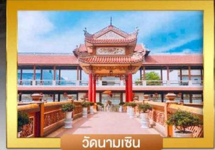
วัดนามเซิน