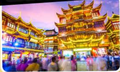
ตลาดร้อยปีเฉิงหวังเมี่ยว