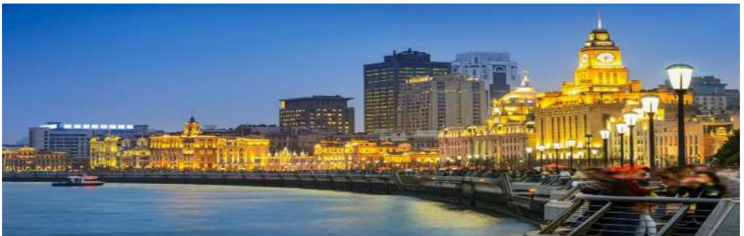
GO1PVG-CA005 ตะลอนเฉิงไฮ้ ปักกิ่ง 6วัน 4คืน (นั่งรถไฟความเร็วสูง) โดยสายการบิน Air China (CA)

07.00 น. เดินทางถึง ท่าอากาศยานนานาชาติเฉิงไฮ้ผู้ตงประเทศจีน เวลาท้องถิ่นเร็วกว่าประเทศไทย 1 ชั่วโมง (เพื่อความสะดวกในการนัดหมาย กรุณาปรับนาฬิกาของท่านเป็นเวลาท้องถิ่น) หลังจากท่านได้ผ่านพิธีการตรวจคนเข้าเมืองและศุลกากร