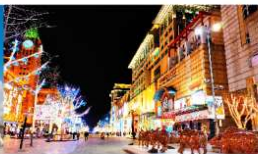
ถนนหวังฟูจิ่ง