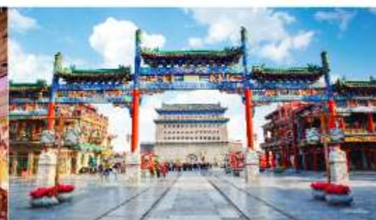
ถนนโบราณเฉียนเหมิน

*ทางบริษัทฯ ขอสงวนสิทธิ์ในการสลับโปรแกรมทัวร์ตามความเหมาะสมขึ้นอยู่กับสถานการณ์หน้างาน โดยคำนึงถึงผลประโยชน์ของลูกค้าเป็นสำคัญ