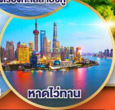
หาดไว่ทาบ