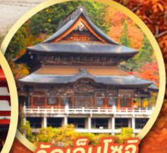
วัดเอ็นโซจิ

กิจกรรมเก็บผลไม้ พักออนเซ็น 2 คืน พักโรงแรมในโตเกียว 2 คืน