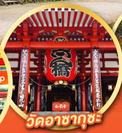
วัดอาซากุซะ