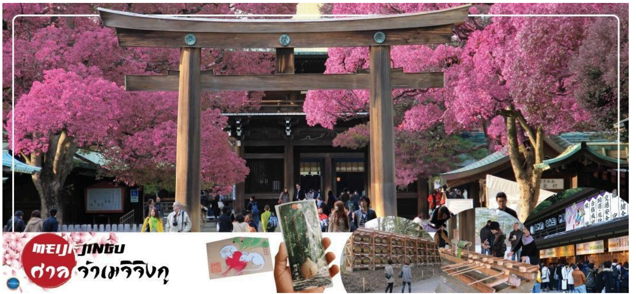
MEIJI JINGU ศาลเจ้าเมจิ

รับประทานอาหารเช้า ณ ห้องอาหารของโรงแรม (5) นำท่านเดินทางสู่ สวนชินจูกุเกียวเอ็น (Shinjuku Gyoen) (จุดชมซากุระขึ้นกับภูมิอากาศ) (ใช้เวลาเดินทางประมาณ 1.20 ชั่วโมง) พื้นที่สีเขียวอันกว้างใหญ่ที่เคยเป็นเขตคฤหาสน์ขามูไรในสมัยเอโดะถูกเปลี่ยนให้เป็นสวนสาธารณะในปี 1949 ตั้งแต่นั้นเป็นต้นมากลายเป็นสถานที่พักผ่อนยอดนิยมของคนโตเกียวที่อยากเพลิดเพลินกับธรรมชาติ มีทางเดินที่เต็มไปด้วยสีเขียวและดอกไม้ตามฤดูกาล ที่นี่จึงเป็นสถานที่อันเงียบสงบซึ่งเหมาะที่สุดสำหรับการเดินเล่นในช่วงเช้าและช่วงบ่าย เมื่อเข้าไปในสวน จะเริ่มได้ยินเสียงนกร้องเพลงแทนเสียงอึกที่ครึกโครมในตัวเมือง สวนชินจูกุเกียวเอ็นเป็นสวนที่มีลักษณะเฉพาะ 3 สวน คือสวนญี่ปุ่น สวนไม้ตัดแต่ง และสวนที่จัดตกแต่งแบบธรรมชาติ และในฤดูใบไม้ผลิ ต้นซากุระประมาณ 900 ต้น จะล้อมสวนให้เป็นสีชมพูด้วยดอกไม้อันแสนงดงาม ที่แห่งนี้จึงเป็นที่นิยมอย่างมากในช่วง ปลายเดือนมีนาคม ถึง กลางเดือนเมษายน นอกจากนี้ยังมีแกลเลอรีศิลปะ อีกด้วย จากนั้นนำท่านเดินทางสู่ ศาลเจ้าเมจิ (Meiji Jingu) (ใช้เวลาเดินทางประมาณ 10 นาที) เป็นสถานที่ศักดิ์สิทธิ์ของกรุงโตเกียว สร้างขึ้นเพื่อสักการะพระเจ้าจักรพรรดินีแห่งยุคเมจิ ที่ครองราชย์ ในสมัยปี 1867-1912 หลังจากที่พระเจ้าจักรพรรดิเมจิสิ้นพระชนม์ ผู้คนในโตเกียวต่างเรียกร้องที่อยากจะทำสร้างศาลเจ้าเพื่อใช้สักการะพระเจ้าจักรพรรดิเมจิ ขึ้นชื่อเรื่องการขอพรกับเทพเจ้า และเครื่องรางนำโชคของศาลเจ้าเมจิที่มีหลากหลายประเภท จึงมีลักษณะเฉพาะที่ไม่เหมือนที่อื่น ซึ่งสามารถเข้าไว้พกติดตัวได้อีกด้วย