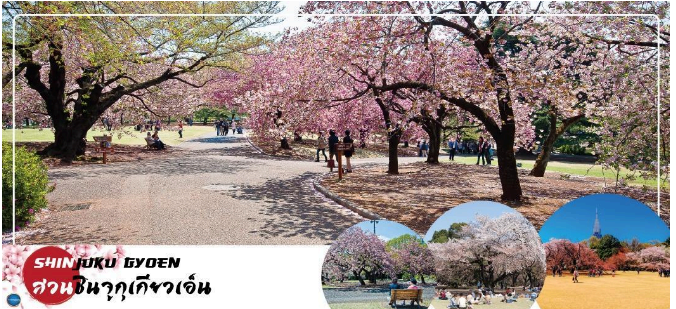
SHINJUKU GYOEN สวนชินจูกุเกียวเอ็น