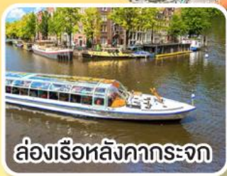
ล่องเรือหลังคากระจก

พิเศษ!! เมนูหอยแมลงภู่อบไวน์ขาว ล่องเรือหมู่บ้านไรกนบ ที่รูน