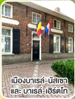
เมืองบารส์-นัสซา และ บารส์-เฮิร์ตโก