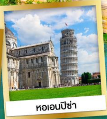
หออนปิซ่า