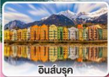
อินส์บรุค