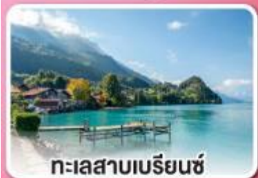
ทะเลสาบเบรียนซ์