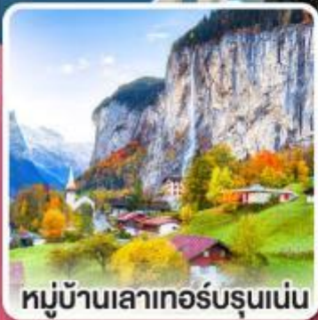
หมู่บ้านเลาเทอร์บรุนเนอร์