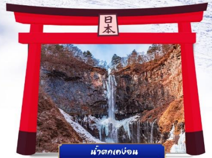
น้ำตกเคงอน