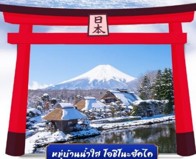
หมู่บ้านน้ำใส ไอชิโนะฮะชิโด