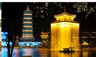
ล่องเรือฉู่หนี่โจว