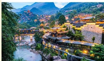
หุบเขาเทวดาฉางเซียนกู่