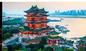
หอเจิ้งหวัง

*ทางบริษัทฯ ขอสงวนสิทธิ์ในการสลับโปรแกรมทัวร์ตามความเหมาะสมขึ้นอยู่กับสถานการณ์หน้างาน โดยคำนึงถึงผลประโยชน์ของลูกค้าเป็นสำคัญ