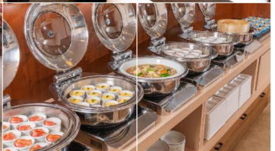
Alpico Plaza Hotel