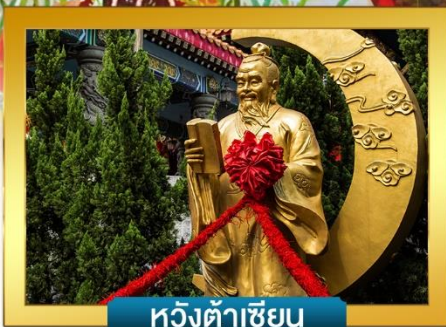
หวังต้าเซียน