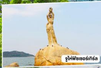
จูไห่พิชเชอร์เกิร์ล