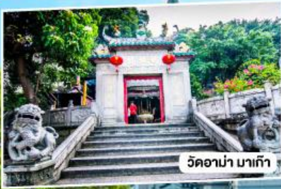
วัดอาม่า มาเก๊า