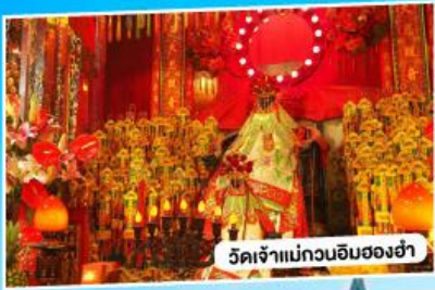
วัดเจ้าแม่กวนอิมของอ่า

*นั่งรถข้ามสะพานเซ็นเจิ้น-จงซาน "สะพานข้ามทะเลที่สูงที่สุดในโลก"