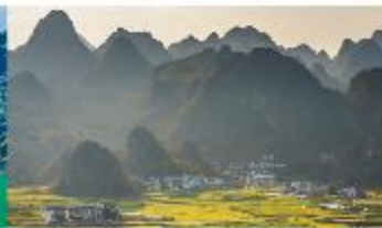
ป่าภูเขามื่นยอด