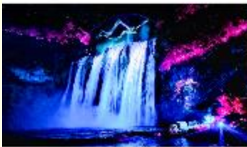
อุทยานน้ำตกหวงโก๋ซู่