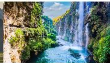
ชุมชนน้ำตกร้อยสายหม่าหลิงเหอ

*ทางบริษัทฯ ขอสงวนสิทธิ์ในการสลับโปรแกรมทัวร์ตามความเหมาะสมขึ้นอยู่กับสถานการณ์หน้างาน โดยคำนึงถึงผลประโยชน์ของลูกค้าเป็นสำคัญ