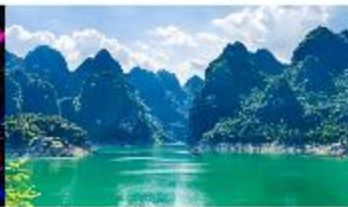
ทะเลสาบวันฟงหู