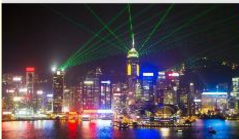
Symphony of Lights