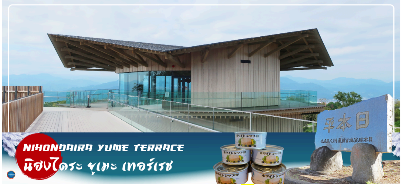
NIHONDAIRA YUME TERRACE นิสงไดระ ยูเมะ เทอร์เรซ