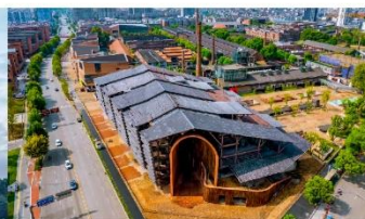
ลานวัฒนธรรมเถาซีชวน