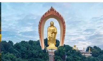
พระใหญ่ตงหลิน