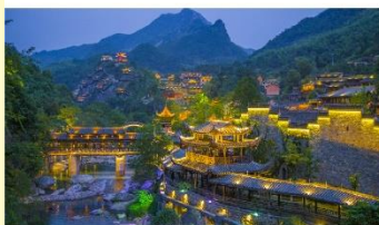
หุบเขาเทวดาวังเซียนกู่