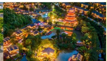
หมู่บ้านเกอเซียน

*ทางบริษัทฯ ขอสงวนสิทธิ์ในการสลับโปรแกรมทัวร์ตามความเหมาะสมขึ้นอยู่กับสถานการณ์หน้างาน โดยคำนึงถึงผลประโยชน์ของลูกค้าเป็นสำคัญ