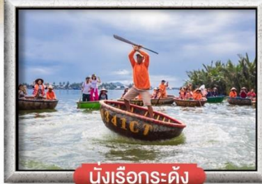
นั่งเรือกระดัง