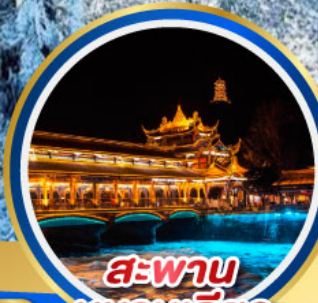
สะพาน หนานเฉียว