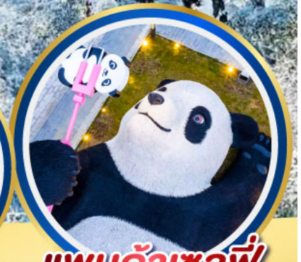
แพนต้าเซลฟี่