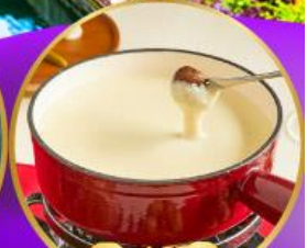
ฟองดูซีส