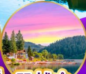
ทิกเกเซ่ ปาดำ