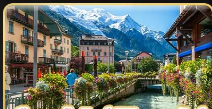
เยือนซาโมนิช พิชิตมงบลังก์