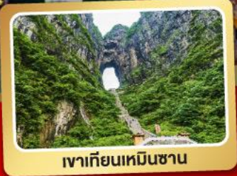
เขาเทียนเหมินซาน