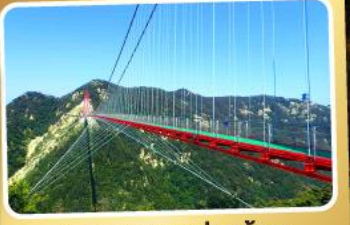
สะพานแวนอ้ายจ้าย