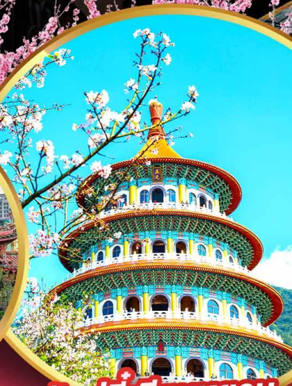
วัดอู่จีเทียนหยวน