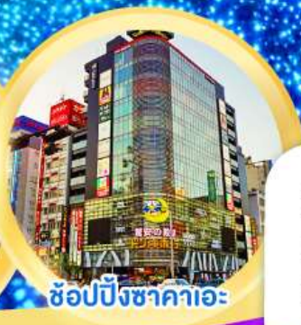
ช้อปปิ้งซากาเอะ