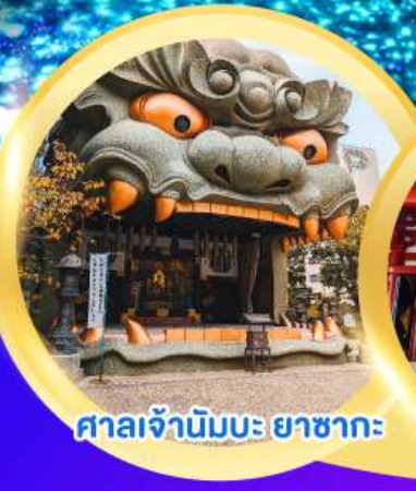
ศาลเจ้านัมบะ ยาชากะ

งานเทศกาลประดับไฟซากามิโกะ อิลลูมินเชั่น พักออนเซ็น 1 คืน พักโฮซาก้า 2 คืน