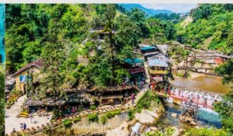
หมู่บ้านก๊ต ก๊ต