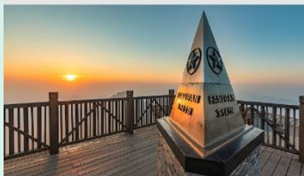
ฟานซิปัน