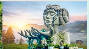
โมอาน่าคาเฟ่

*ทางบริษัทฯ ขอสงวนสิทธิ์ในการสลับโปรแกรมทัวร์ตามความเหมาะสมขึ้นอยู่กับสถานการณ์หน้างาน โดยคำนึงถึงผลประโยชน์ของลูกค้าเป็นสำคัญ