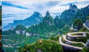
ถนน 99 โค้ง