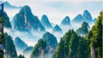
เขาวงตาร

*ทางบริษัทฯ ขอสงวนสิทธิ์ในการสลับโปรแกรมทัวร์ตามความเหมาะสมขึ้นอยู่กับสถานการณ์ปัจจุบัน โดยคำนึงถึงผลประโยชน์ของลูกค้าเป็นสำคัญ