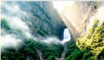
ประตูลั่วหลิง