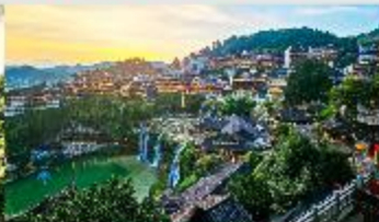
เมืองโบราณฝูหลงเจิน