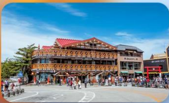
ภูเขาไฟฟูจิ ชั้นที่ 5