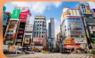
ซ้อปปิ้งชินจูกุ