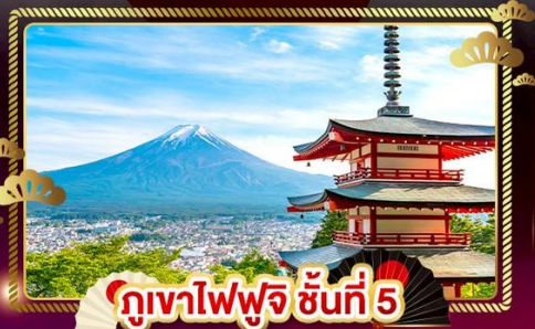
ภูเขาไฟฟูจิ ชั้นที่ 5

ชมลาวเอนเดอร์ ที่ สวนไอชิปาร์ค อิสระ 1 DAY TRIP