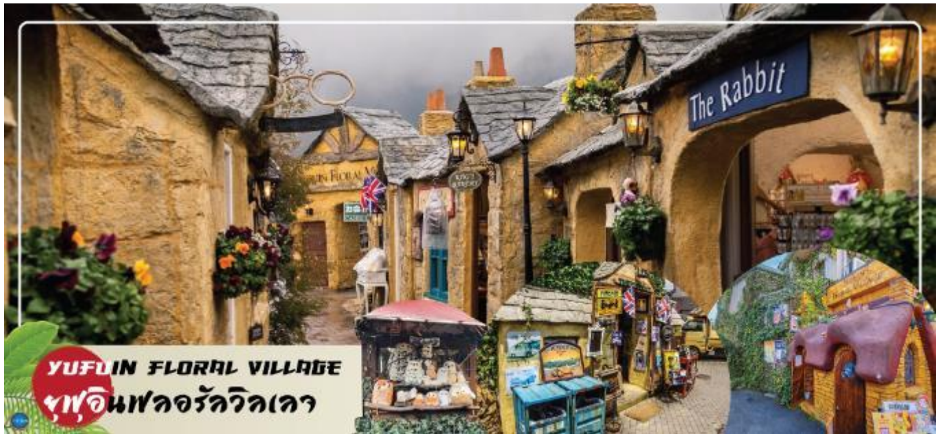
YUFUIN FLORAL VILLAGE ฟูอินฟลอรัลวิลเลจ

เที่ยง เลือกรับประทานอาหารกลางวัน ณ หมู่บ้านยูฟุอินตามอัตราค่าตัว(3) Cash Back ท่านละ 1000 เยน (จ่ายโดยไกด์หน้างาน)